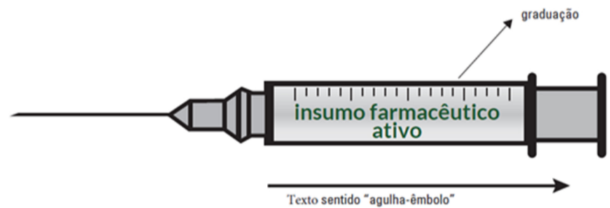
Figura 4 - Texto começando do fim da agulha